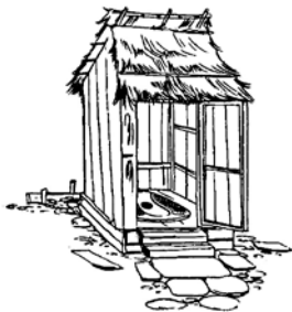
အိမ်သာတက်ပြီးနောက်