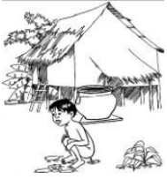
ဝမ်းလျှော