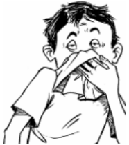
အအေးမိ / ဖျားနာ