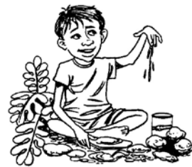
အပြင်တွင်ဆော့ကစားပြီးနောက်