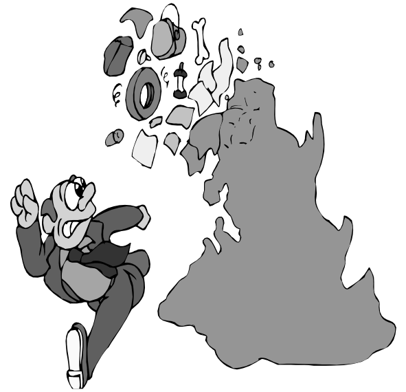
Created by Life Wind International

မည်သည့်အရာကိုအမှိုက်များနှင့်အတူမပြုလုပ်ရမည်နည်း။